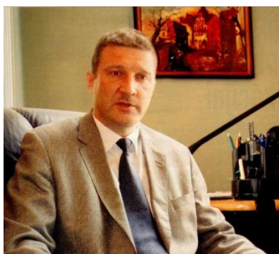
Finanšu ministrijas Valsts kases departamenta direktors, Valsts kases pārvaldnieks no 1993.-2003.gadam