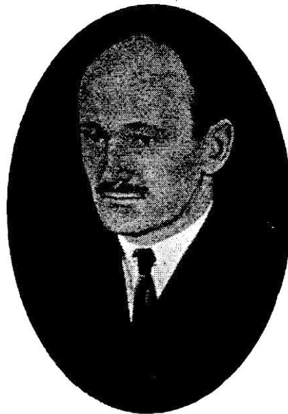
Valsts kases pārvaldnieks, Valsts kases departamenta direktors no 1919.-1922. gadam